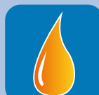
EXTRA ACIDES GRAS ESSENTIELS

Hautes teneurs en oméga 3 et 6 via un complexe d'huiles végétales naturelles qui permet un apport énergétique sécurisé.