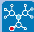
ACIDES AMINÉS ESSENTIELS

+ Aide à rétablir une activité normale de l'estomac