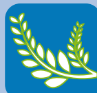
FAIBLE TAUX D'AMIDON / TENEUR ÉLEVÉE EN FIBRES

+ Soutient nutritionnel du cheval athlète